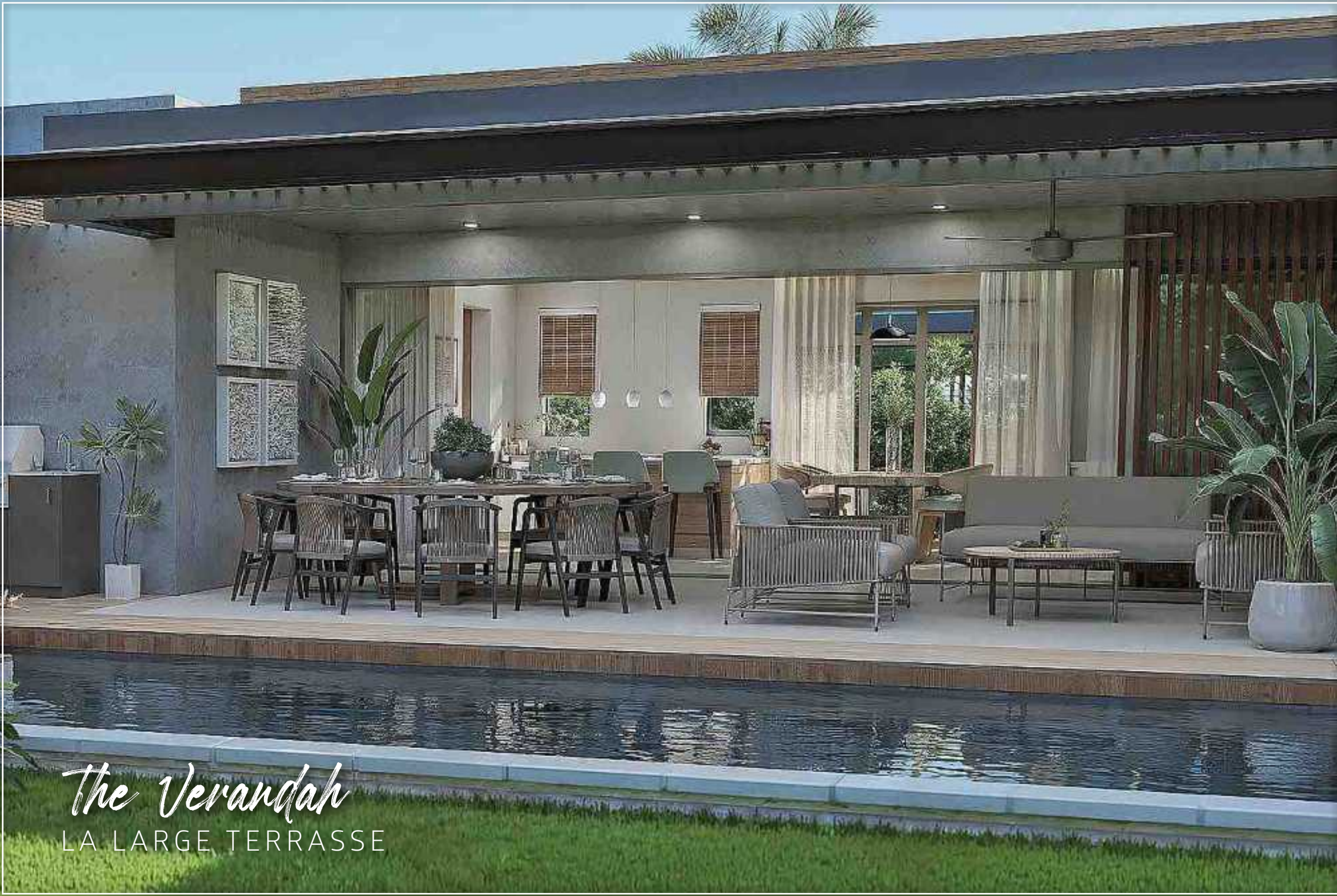
The Verandah LA LARGE TERRASSE