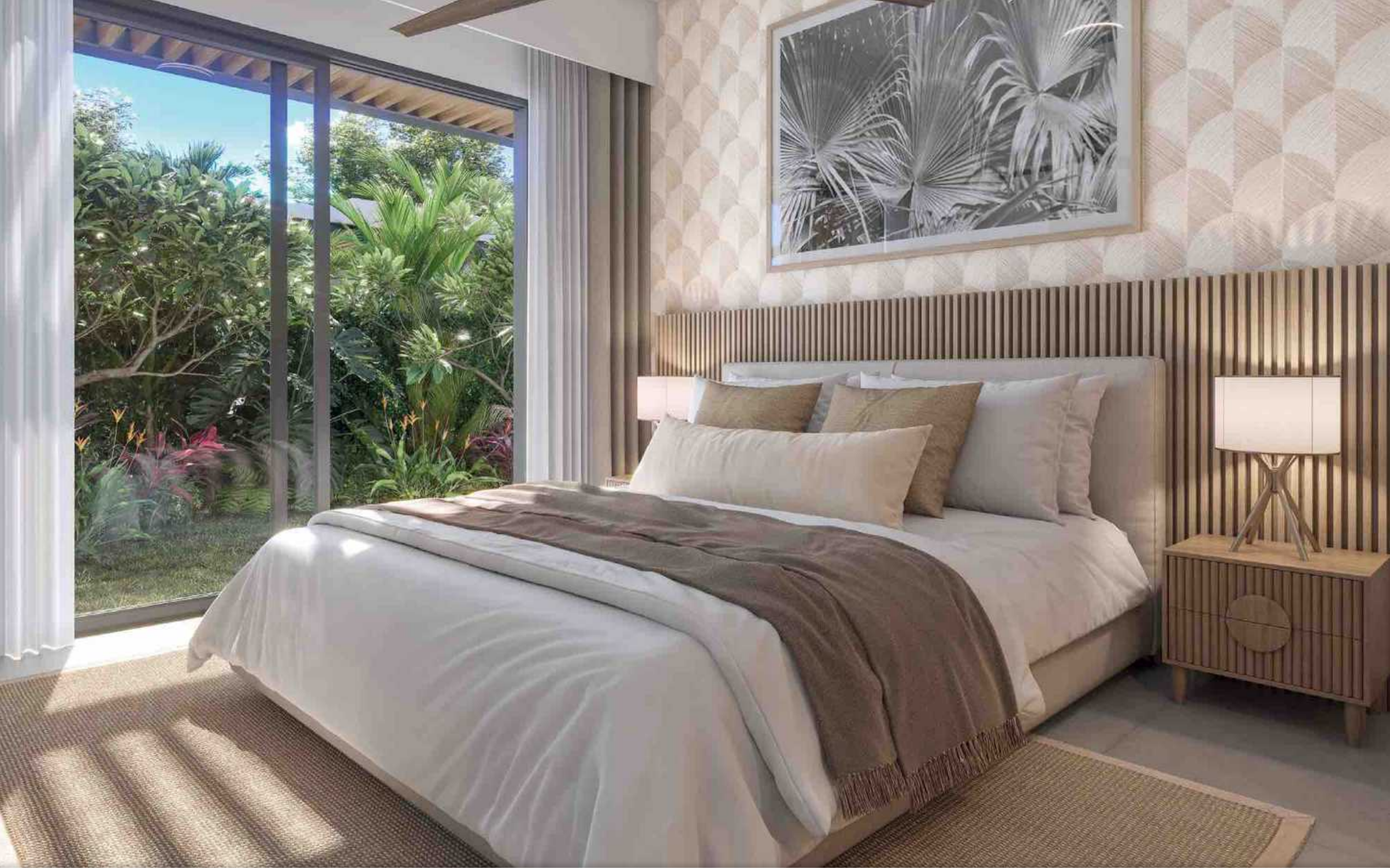
Bedroom No 2 CHAMBRE No 2